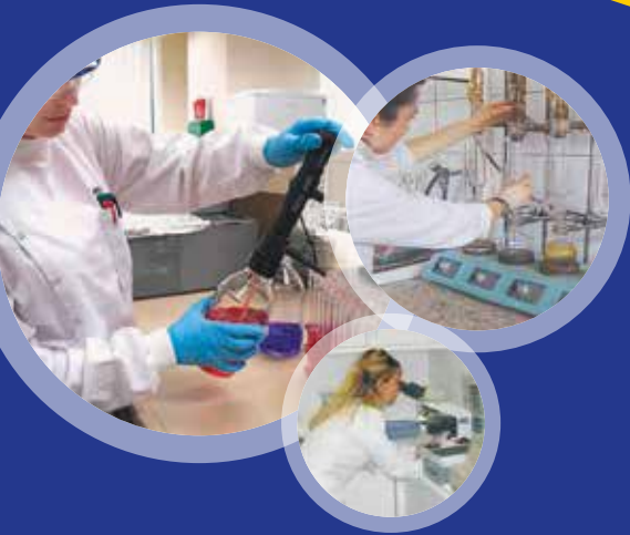
Laboratuvar & Ar-Ge